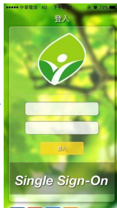
圖 2 帳密輸入頁