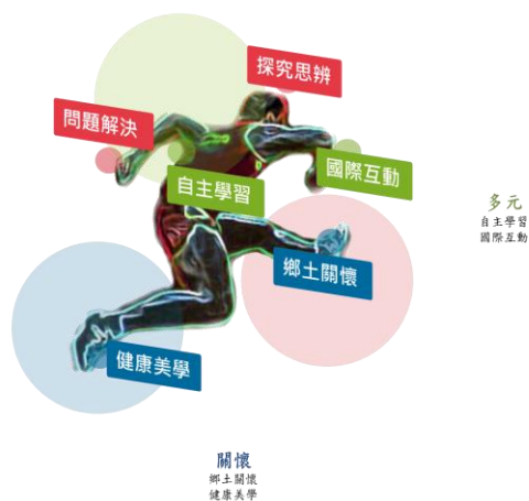
圖 2 金山高中學生圖像