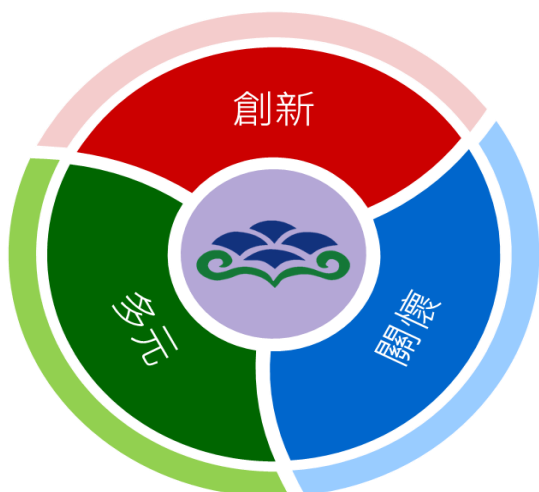
圖 1 金山高中學校願景

以十二年國民基本教育課程綱要為本，培養學生探索精神，學習發現問題、解決問題的歷程，並以本校「創新、關懷、多元」之願景，建構「愛·探索教育學園」，培養學生「探究思辨、問題解決、鄉土關懷、健康促進、自主學習、國際互動」六大項核心能力為精神，增進學生全球競爭力。