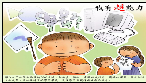
部份自閉症學生具備特別的天賦，如繪畫、藝術、電腦程式設計、複雜的運算等，請給他適當的學習環境、更多學習及獲得成就感機會。

他們有特殊的選擇性和固執性，如堅持固定的食物、位子、路線、話題、行為模式等，如果這些固定的習慣被改變了，他會相當的不安、焦慮和害怕。