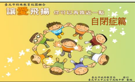
讓愛飛揚—你可以再靠近一點

他們有特殊的選擇性和固執性，如堅持固定的食物、位子、路線、話題、行為模式等，如果這些固定的習慣被改變了，他會相當的不安、焦慮和害怕。