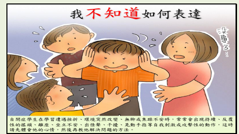
自閉症學生在學習遭遇挫折、環境突然改變、無聊或焦躁不安時，常常會出現持續、反覆性的搖頭、離座出怪聲等自我刺激或攻擊性的動作，這時請先體會他的心情，然後再教他解決問題的方法。

自閉症學生很難管理自己或者常用不正確的方式遊戲，同學除了要盡量邀請他參加團體活動外，同時可以明確告訴他遊戲規則及方法，並協助他反覆練習。