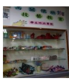
發現同學美的眼睛-作品成果