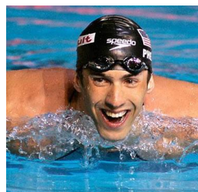
菲爾普斯 (奧運游泳好手)