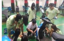
國三參訪南強工商：汽車科