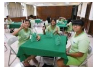
國三參訪開明高職：餐飲科