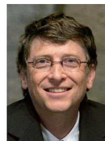
比爾蓋茲 (微軟創辦人)