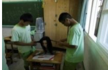
國二技職試探：美髮體驗課程