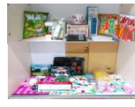
英雄們可兌換的獎品