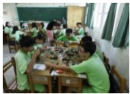
國二技職試探：LED 焊接

今年暑假，生涯發展組安排了一系列國二技職試探以及國三高職參訪。希望藉由多元職群的體驗活動，讓學生實際探索各種群科特色，從中發現自己的興趣和強項；透過參訪高職特色群科，幫助自己找到未來的方向。