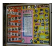
生涯輔導的滿滿收穫與成果