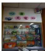
各種豐富的心靈充電工具

輔導處新學期增添了許多小巧思，像是開設了心靈充電站，建置許多讓老師、同學自我充實與療癒的桌遊、牌卡、書籍，還有高關懷與技藝教育的成果展示，與各項升學、生涯探索活動的資訊，歡迎大家來輔導室尋幽探訪。